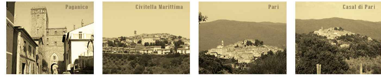
TAV S4 Schedatura patrimonio edilizio esistente - PARI E FERRAIOLA